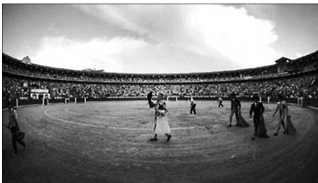
José Tomás llenó la Plaza de Ciudad Real hasta la bandera

Pero paradójicamente - y como contraste radical a lo dicho - se está produciendo en otras plazas una auténtica revolución que sacude sensibilidades diversas, hace tambalear al taurinismo oficial y resulta incómodo a los intereses de figuras, medios y demás estamentos organizados de la fiesta; me refiero al Tomasismo , que ha reaparecido a mitad de temporada y ha puesto patas arriba el espectáculo. He aquí la otra cara de la Fiesta revestida de esperanza y oro . Llenos en los tendidos, reventas por las nubes, expectativas ilusionadas por ver torear al maestro que, después del terrible percance de Aguascalientes, ha vuelto y se pone de nuevo donde cogen los toros, sin inmutarse; es verdad que con el público a su favor, acartelado cómodamente, toritos de ganaderías escogidas, sin trapío... pero, a pesar de ello, siendo hoy el único torero que rezuma verdad y despierta una emoción que las llamadas figuras - con esos mismos toritos carretones y los mismos ventajismos de despachos