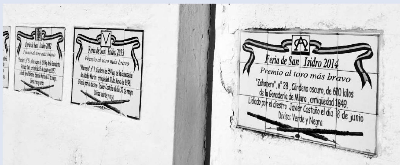
Lápidas honoríficas en el Batán. Arriba la del toro Fuentes, sobre estas líneas las últimas que se pusieron. Esperamos que se recupere la tradición